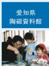
愛知県陶磁資料館