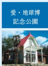
愛・地球博記念公園

リリモ沿線には、愛・地球博記念公園 (モリコロパーク) をはじめ、 楽しい施設がたくさんあり、観光・遠足などに最適 です。 是非、「わくわく貸切 Linimo」体験にお越しください。